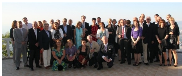
Участниците в Генерална асамблея погледнаха към София от „Копитото“

Подробно бяха разгледани и приети редица документи за работата на INTERGRAF през изминалата година, приета бе и програмата за действие и развитие през 2011 г. Обсъдени бяха някои персонални промени в ръководството на организацията, както и важни финансови въпроси.