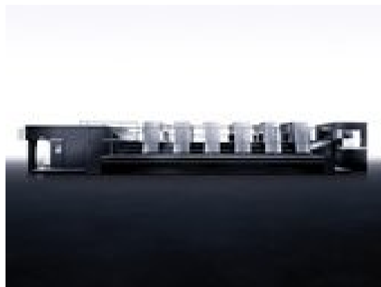
Speedmaster XL 105

Прес-информация на Heidelberg Druckmaschinen AG