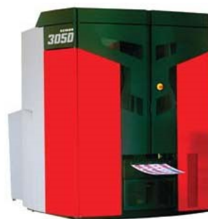
Машината за печат на етикети Heikon 3050

При Heikon 3050 гъвкавата ширина на печатната лента позволява на клиентите ефективно да настроят печатния процес към изискванията, заложи в поръчката. Етикетите се подреждат оптимално в зависимост от размера, в резултат на което се повишава значително производителността. Heikon 3050 печата върху ширини от 250 до 516 мм, включително популярния 330 мм формат.