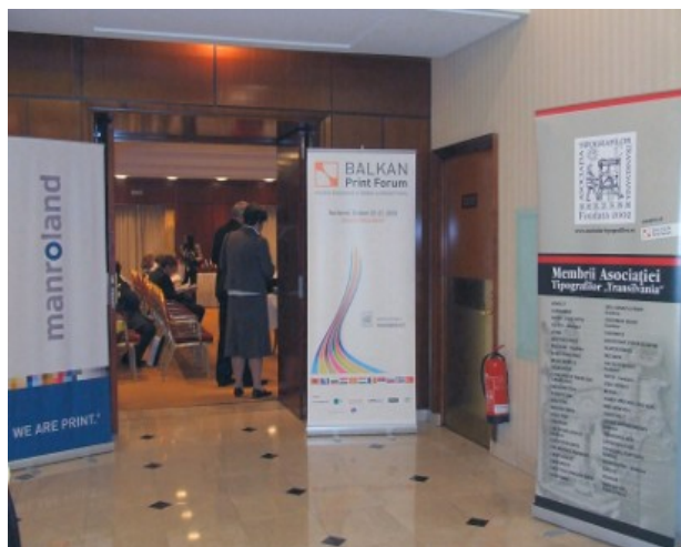
По време на четвъртия Балкански печатарски форум

manroland AG, главен спонсор на Петия Балкански печатарски форум, ко-спонсорите Müller Martini GmbH, Océ Printing Systems GmbH и Leonhard KURZ Stiftung & Co.KG, суб-спонсорът UPM, поддръжниците M-real, Weilburger Graphics GmbH, Agfa Graphics и Sappi, а също и PrintCity Alliance ще представят информационни материали на информационни табла. Това е допълнителна възможност участниците от балканската печатарска медийна общност да получат актуална информация, да установят нови контакти с производители и доставчици, да дискутират важни теми.