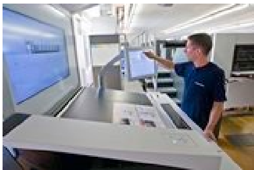
Петцветната Speedmaster SM 74 в печатница Wetterauer е оборудвана с Prinect Axis Control

Неотдавна печатница Wetterauer във Фридберг получи грамота за първата инсталирана в Германия климатично неутрална печатна машина. Петцветната Speedmaster SM 74 с модул за лакиране на Heidelberg Druckmaschinen AG (Heidelberg) бе инсталирана през пролетта на текущата година. Излъчените при изработването на печатната машина емисии бяха точно определени и компенсирани. При това са отчетени всички релевантни параметри – от добива на суровините, подготовката на материалите и до изработването на машината, пробната фаза и транспорта до печатницата. Новата Speedmaster SM 74 печата с намален разход на IPA (изопропилалкохол), което е добре за природната среда, за здравето на работещите и осигурява чистота на въздуха в печатния цех. Освен това печатната машина е оборудвана със стандартната система за измерване и регулиране Prinect Axis Control, която измерва цветовете стойности по печатна контролна лента и след това регулира цвета online. По този начин се намалява макулатурата, което е сериозна възможност за производство с икономия на ресурси.