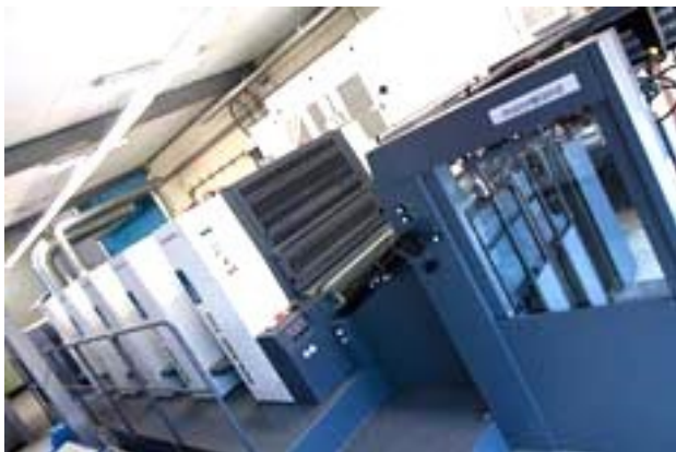
С новата ROLAND 700 HiPrint iDrukker в Ротердам изпълнява online пръчки бързо и ефективно