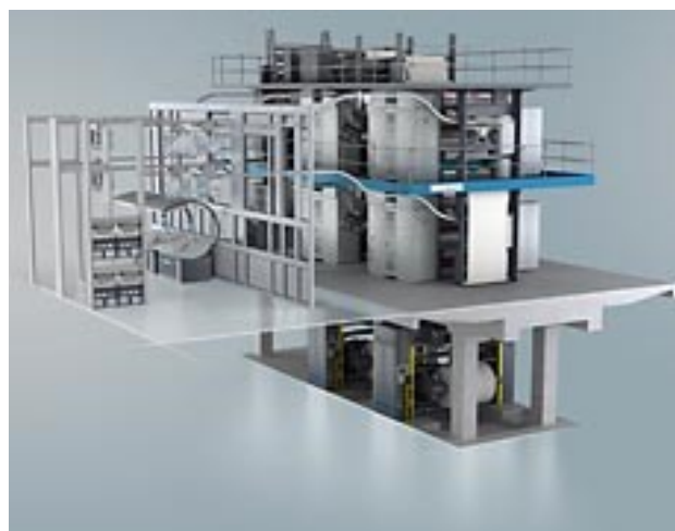
APL logistics: интегрираният работен поток за логистика на печатните форми

Пресконференцията за журналисти ще се състои в понеделник, 4-и октомври 2010 г. в 18.00 часа в конгресния център А на панаирния град Хамбург, зала Прага.