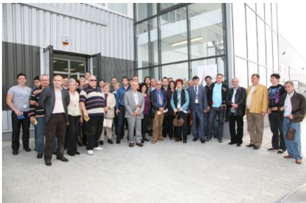
Гостите на четвъртия Балкански печатарски форум по време на посещенията на печатница EDS Romania в Гимбав, недалеч от Брашов

Инициатори на Балканския печатарски форум са Съюзът на печатарската индустрия в България и manroland AG. Балканският печатарски форум бе създаден на 26.10.2006 г. във Велинград, България. Концернът manroland AG пое патронажа на проекта.