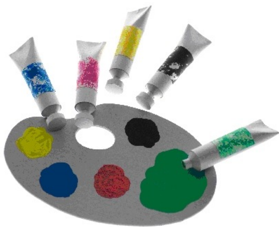
manroland притежава петия цвят – CMYK + GREEN

Не е нужно да купуваме това, което имаме. Топлина се отделя при множество производствени процеси. Произведената топлина може да се използва за други цели чрез извеждането ѝ от текущите процеси.